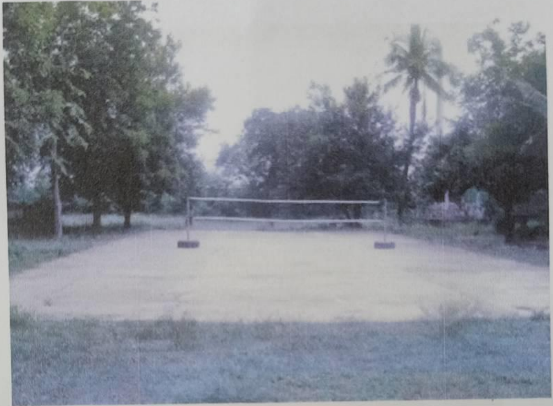
ภาพ : สนามกีฬาหมู่บ้าน หมู่ที่ ๕ บ้านปลายทับใหม่